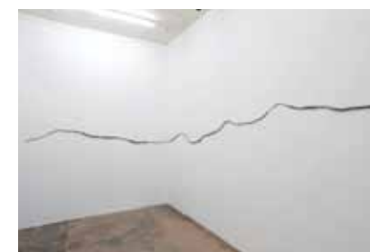
Katinka Bock, Partition en automne (2009). Collection FRAC Poitou-Charentes François Doury © Galerie Jocelyn Wolff