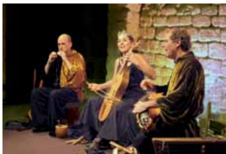
Arsène et la corne magique