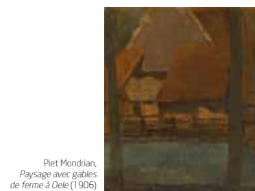
Piet Mondrian, Paysage avec gables de ferme à Oete (1906)