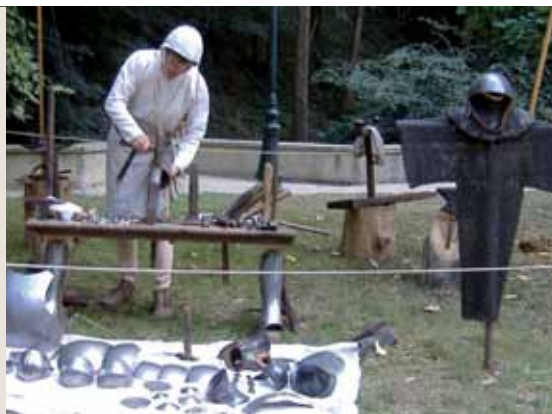
Benoît Gilles, batteur d'armure © Benoît Gilles

Forgeron d'état, le batteur d'armure est l'artisan médiéval spécialisé dans la fabrication des pièces d'armure à la fin du Moyen Âge et à la Renaissance. Un atelier est présenté regroupant des outils emblématiques du métier. Les diverses techniques employées sont ainsi expliquées au public et permettent de mettre en forme le métal comme les pièces de maille rivetées. Ce discours didactique s'accompagne de planches imprimées présentant des batteurs d'armure et des fourbisseurs, ainsi que l'évolution de l'armure au Moyen Âge.